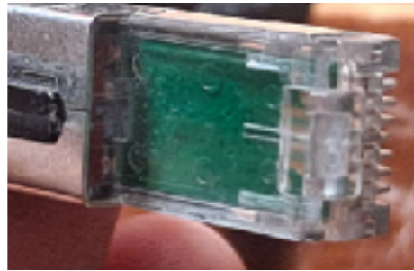
Patilla de agarre rota

No los dobles, no los pilles con una puerta, tapa los conectores con el protector, manténlos limpios y cuida que la patilla no se rompa para que al introducirlo en una toma haya buena conexión.